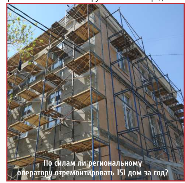
По силам ли региональному оператору отремонтировать 151 дом за год?